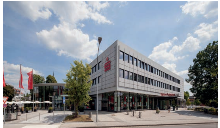
Die Sparkasse Forchheim stellt 2025 unter Beweis, wie exzellente, nachhaltige Beratungsqualität in Forchheim aussieht.

Die besondere Herausforderung war es, den Interessenten umfassend und bedarfsgerecht zu beraten. Die BeraterInnen der Sparkasse haben es sehr gut verstanden, eine äußerst angenehme Gesprächsatmosphäre herzustellen und dabei alle wichtigen Kundeninformationen in Erfahrung zu bringen. Dies war die Grundlage für eine exzellente Beratungsleistung sowohl im Hinblick auf das konkrete Interesse an einem neuen Girokonto als auch für das Erkennen weiterer Bedarfe in den Bereichen Absicherung und Altersvorsorge.